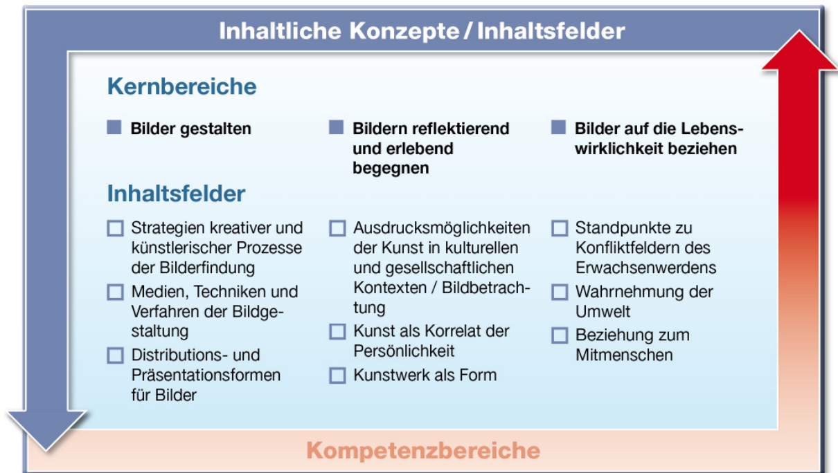
Abb. 2: Kernbereiche und Inhaltsfelder